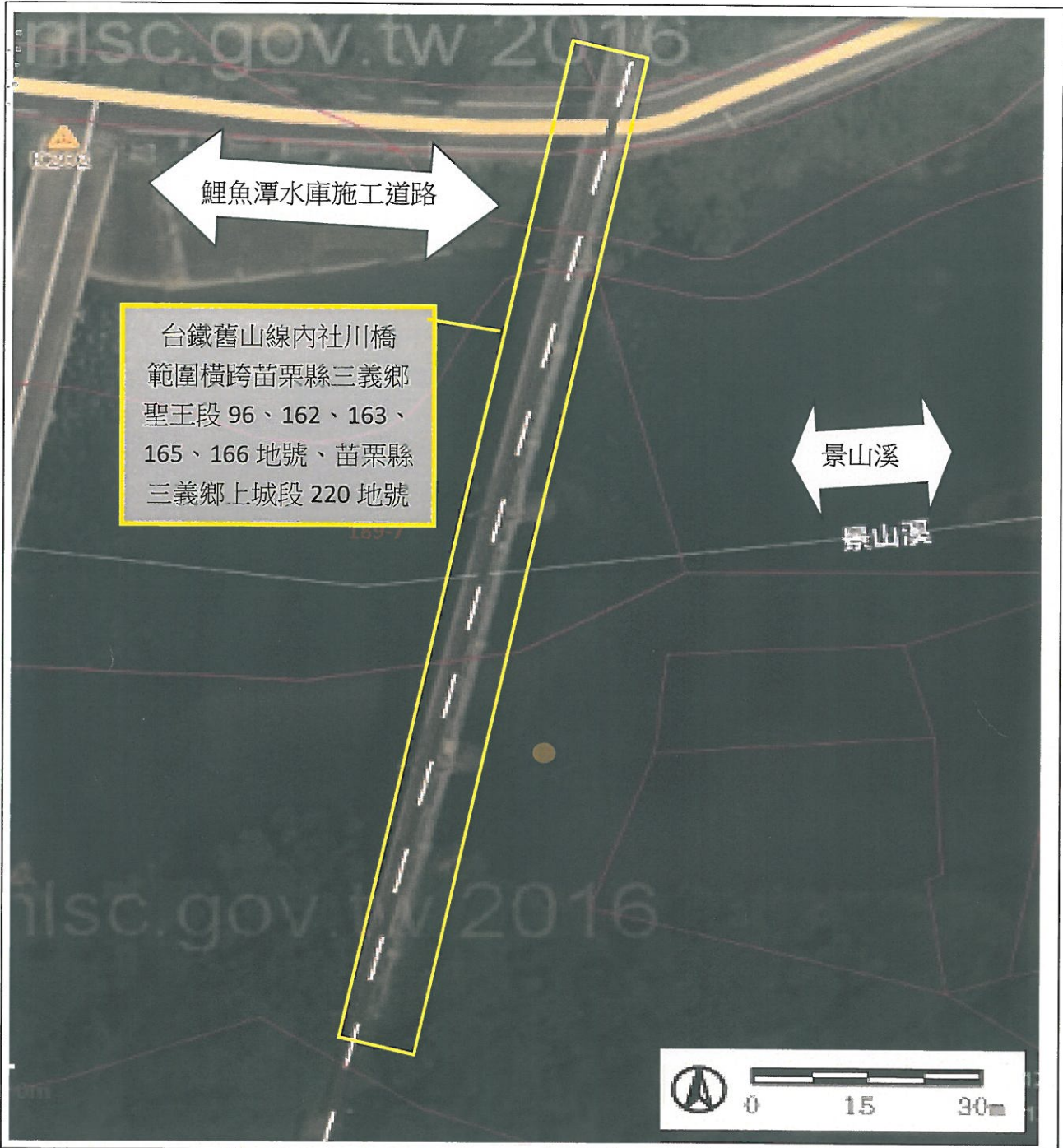
「臺鐵舊山線－內社川鐵橋」航照圖